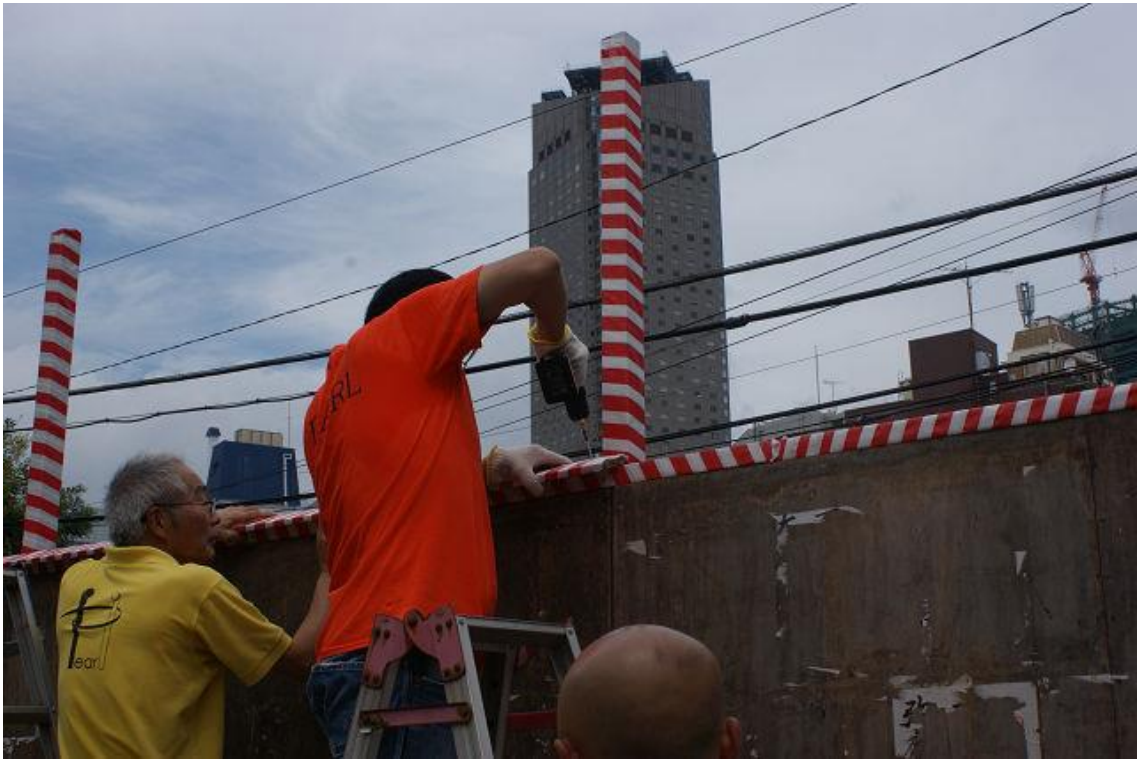
掲示板の屋根を設置。薄細井板を屋根の笠に見立て、斜めに釘打ち！ 段々ゴールが見えてきました。