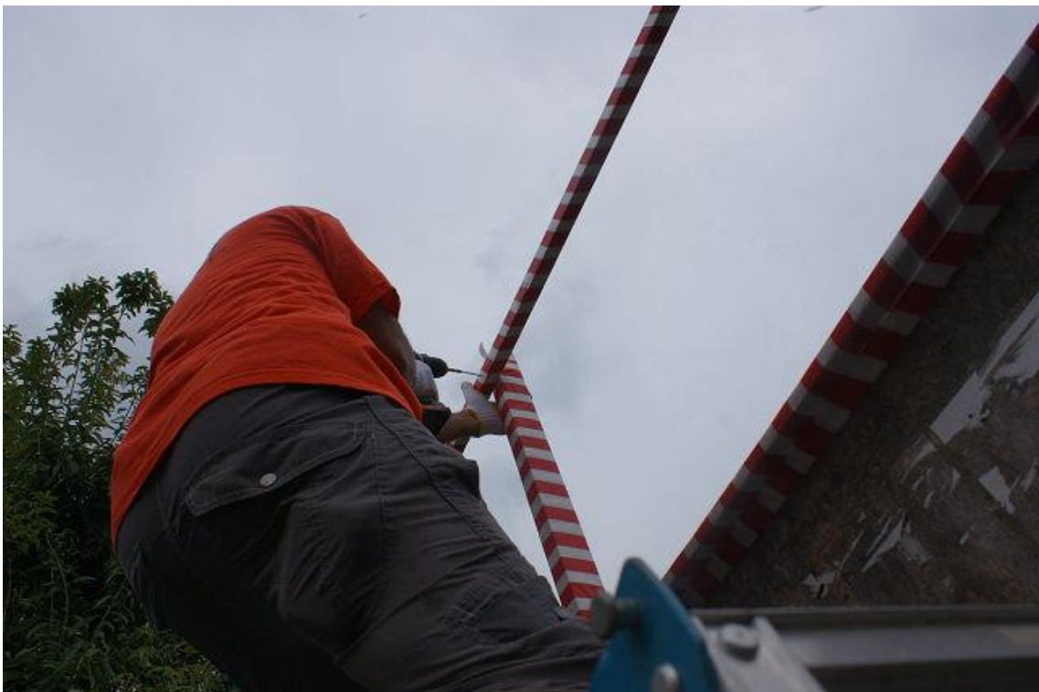
掲示板最上部の作業。落ちないように気を付けて・・・。